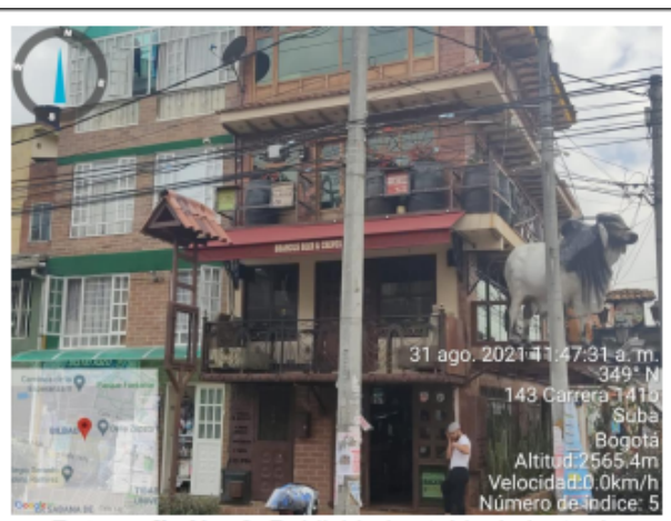
Fotografía No. 2. Publicidad establecimiento de comercio