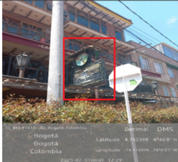
Foto panorámica del establecimiento donde se identifica: un (1) elemento no regulado