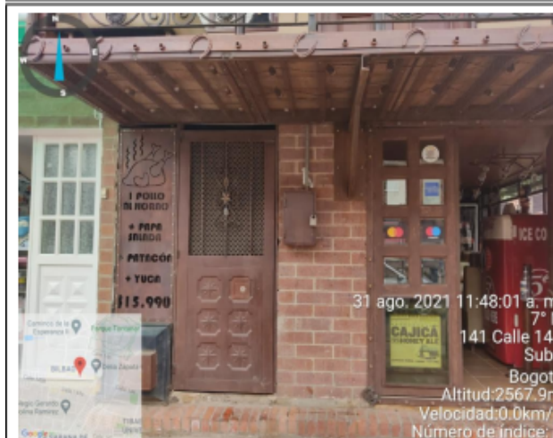
Fotografía No. 3. Publicidad en puertas.