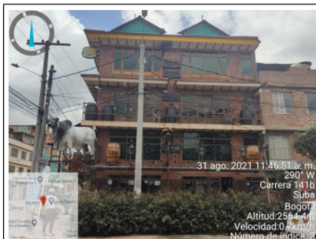
Fotografía No. 1. Publicidad establecimiento de comercio