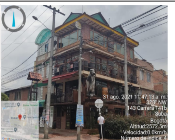
Fotografía No. 4. Foto panorámica.